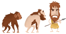
APPARITION DE L'HOMO SAPIENS