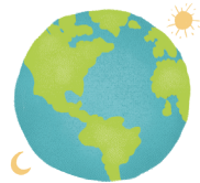
FORMATION DE LA PLANÈTE TERRE