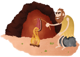
DÉBUT DE L'OCCUPATION HUMAINE DE LA GROTTE DE THAIS

Relie les évènements aux dates sur la frise chronologique !